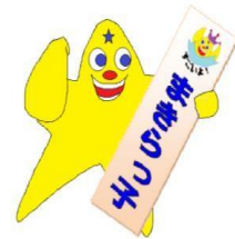
真喜良小マスコット 「キラリン」だよ