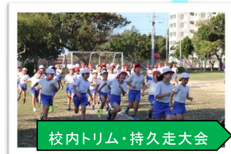
校内トリム・持久走大会