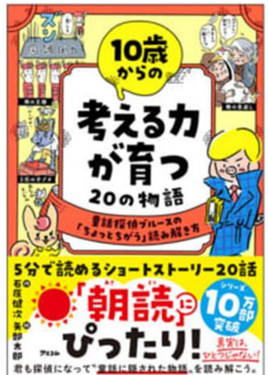
10歳からの考える力が育つ20の物語 (アスコム)

実は私、子供の頃から少し変わってまして（笑）。「アリとキリギリス」を読んでも、「キリギリスってそんなに悪かったのかな？ 僕はアリよりキリギリスの方が好きやけど…」なんて考えてしまうタイプでした。今思えば「別の視点」を探そうとしていたのかもしれませんが（周りからは「あまのじゃく!」と言われてましたが…）。