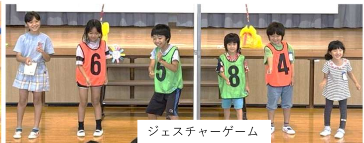
ジェスチャーゲーム