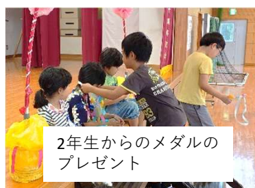
2年生からのメダルのプレゼント

4月24日、児童会主催の1年生を迎える会を実施しました。各学年1年生に喜んでもらえるようにと、プレゼントやレク、ダンスなどを準備し1年生を歓迎しました。1年生もお礼の言葉とダンスをを上手に発表することができました。みんなの優しさが光る迎える会となりました。