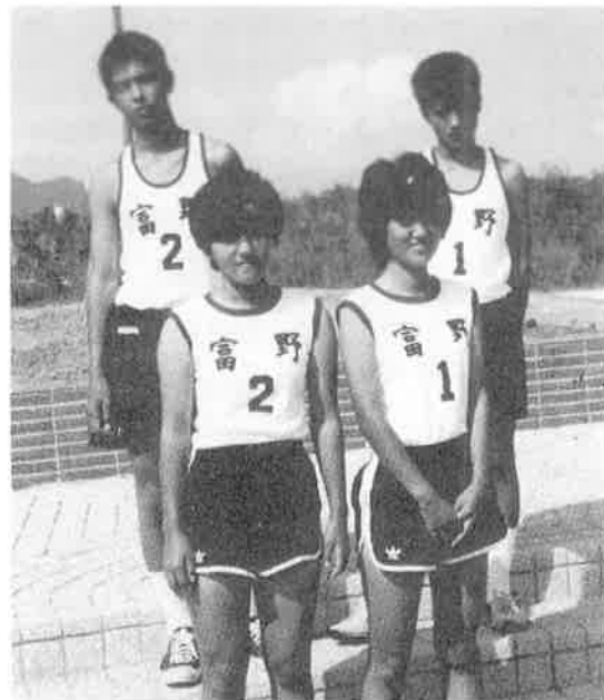
中体連陸上競技大会参加 （撮影 昭和57年10月）