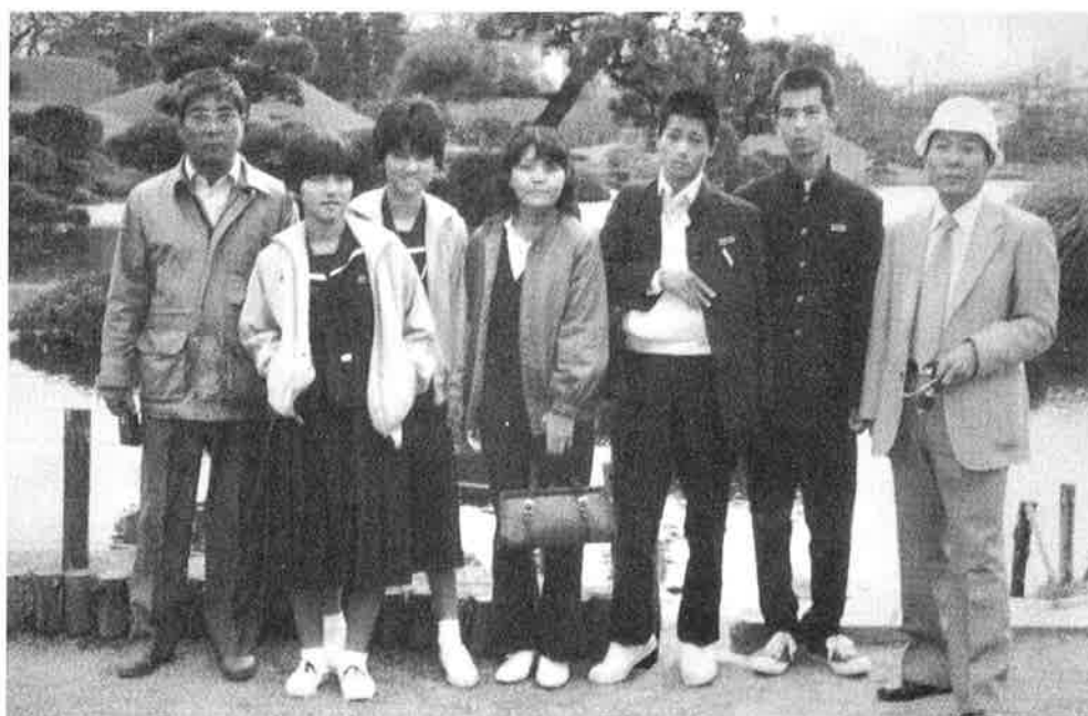
楽しかった修学旅行・熊本の水前寺公園にて（撮影 昭和57年3月）