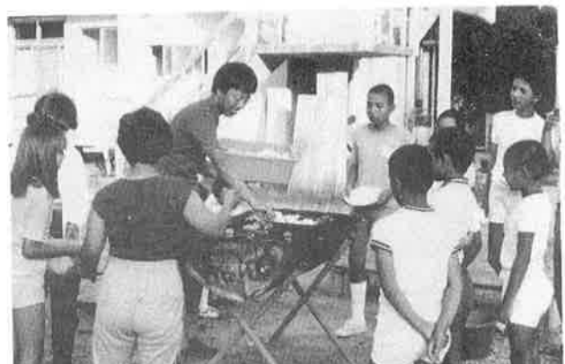
楽しかった修学旅行（西表にて）（撮影 昭和57年7月）