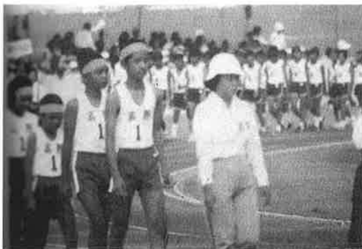
八重山陸上競技大会参加（撮影 昭和57年9月）