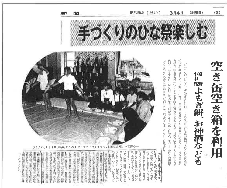
新聞報道されたひな祭り集会（撮影 昭和56年3月）