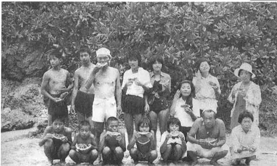
水泳訓練の休暇時間パチリ！（撮影 昭和56年7月）