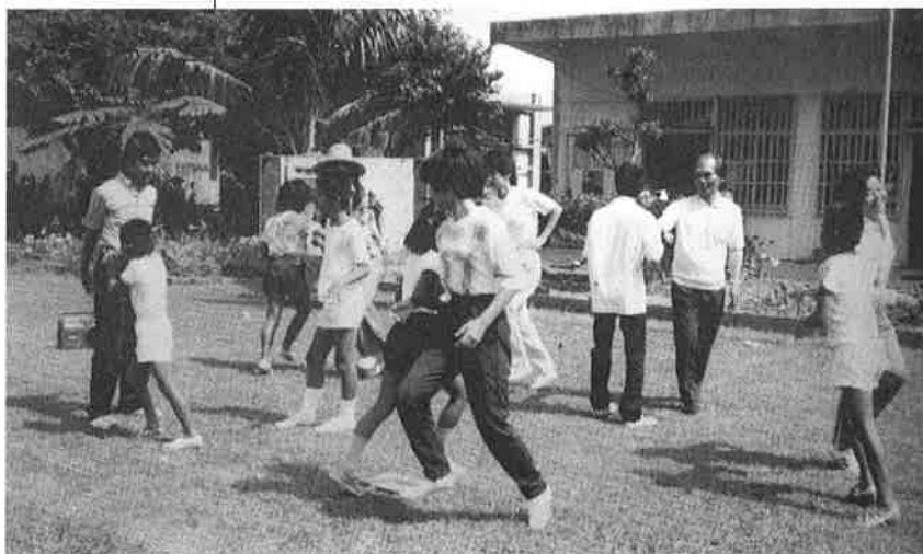
「鯉幟集会」楽しいフォークダンス（撮影 昭和56年5月）