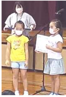
夏休み親子作品展受賞