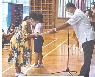
石P連主催童話お話し発表大会受賞