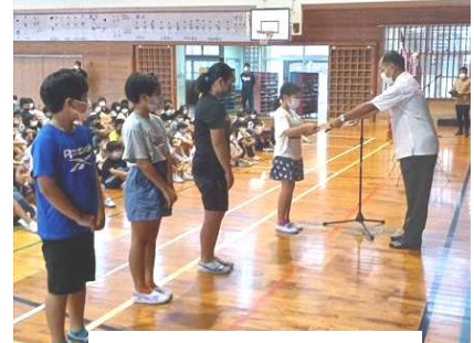
児童生徒の平和メッセージ受賞