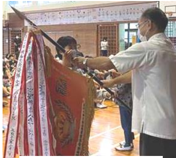
秋・冬季小学生バレーボール大会優勝