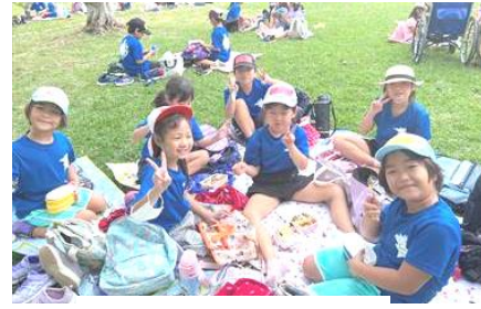
1・2年 中央運動公園