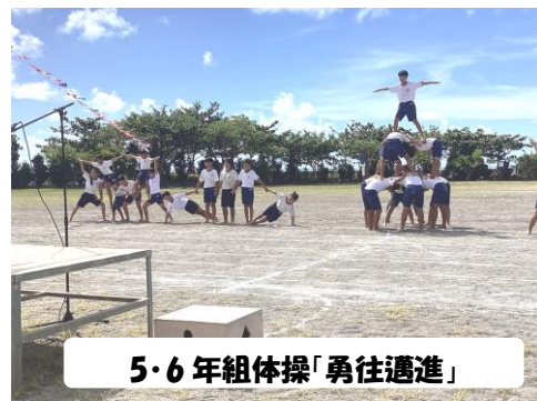
5・6年組体操「勇往邁進」