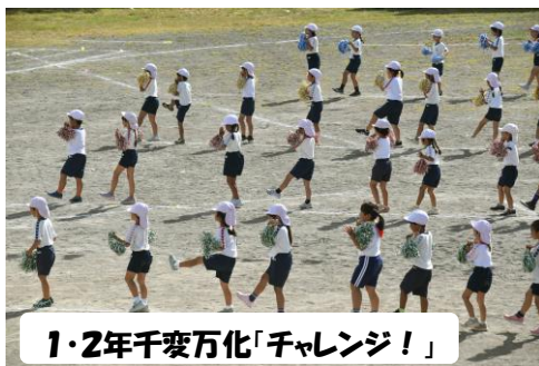
1・2年千変万化「チャレンジ！」