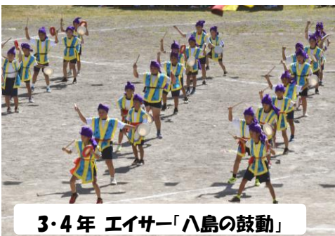
3・4年 エイサー「八島の鼓動」